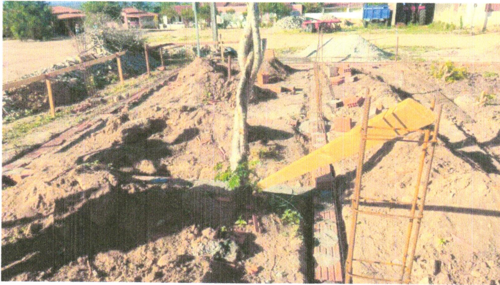
FOTO 11 – LASTRO DE CONCRETO MAGRO, APLICADO EM BLOCOS DE COROAMENTO OU SAPATAS, ESPESSURA DE 3 CM