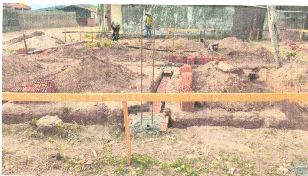
Foto 14- LOCAÇÃO CONVENCIONAL DE OBRA, UTILIZANDO GABARITO DE TÁBUAS CORRIDAS PONTALETADAS