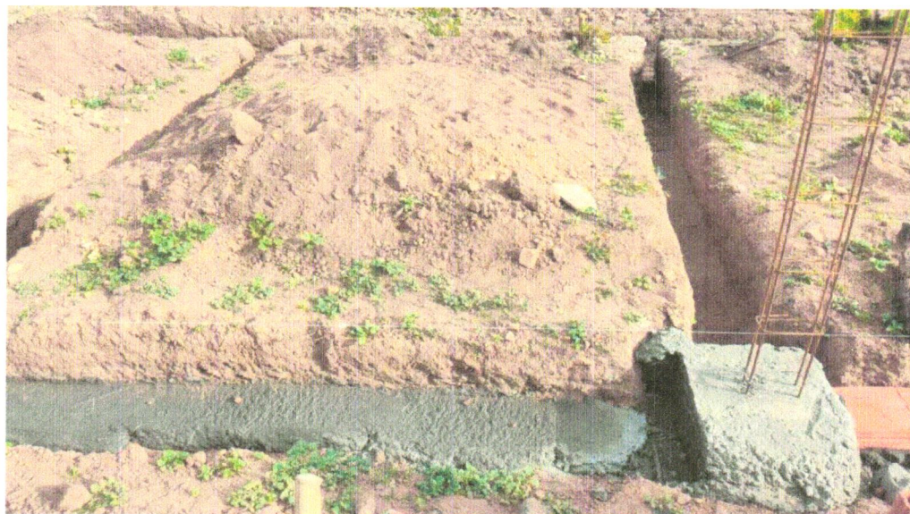
FOTO 08 - LASTRO DE CONCRETO MAGRO, APLICADO EM BLOCOS DE COROAMENTO OU SAPATAS, ESPESSURA DE 3 CM