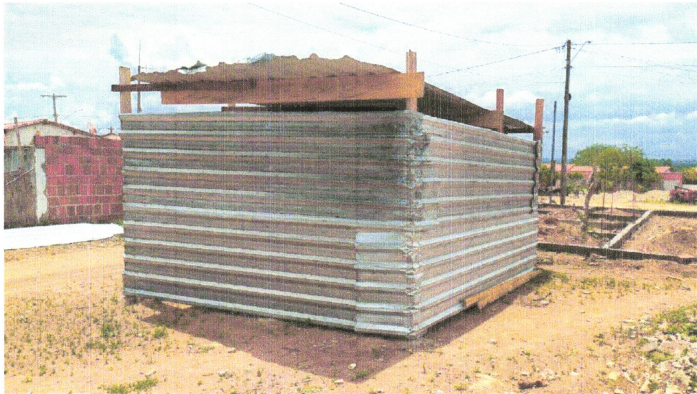
FOTO 03 - Barracão para Obras de Médio Porte Reaproveitamento 2 vezes