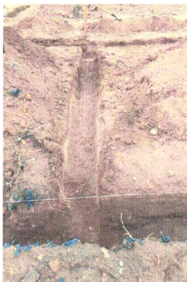
Foto 07 – ESCAVAÇÃO MANUAL DE VALA PARA VIGA BALDRAME (INCLUINDO ESCAVAÇÃO PARA COLOCAÇÃO DE FÔRMAS). AF_06/2017