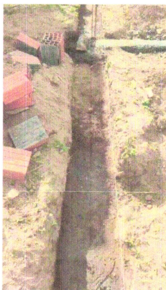
FOTO 09 – ESCAVAÇÃO MANUAL DE VALA PARA VIGA BALDRAME (INCLUINDO ESCAVAÇÃO PARA COLOCAÇÃO DE FÔRMAS). AF_06/2017