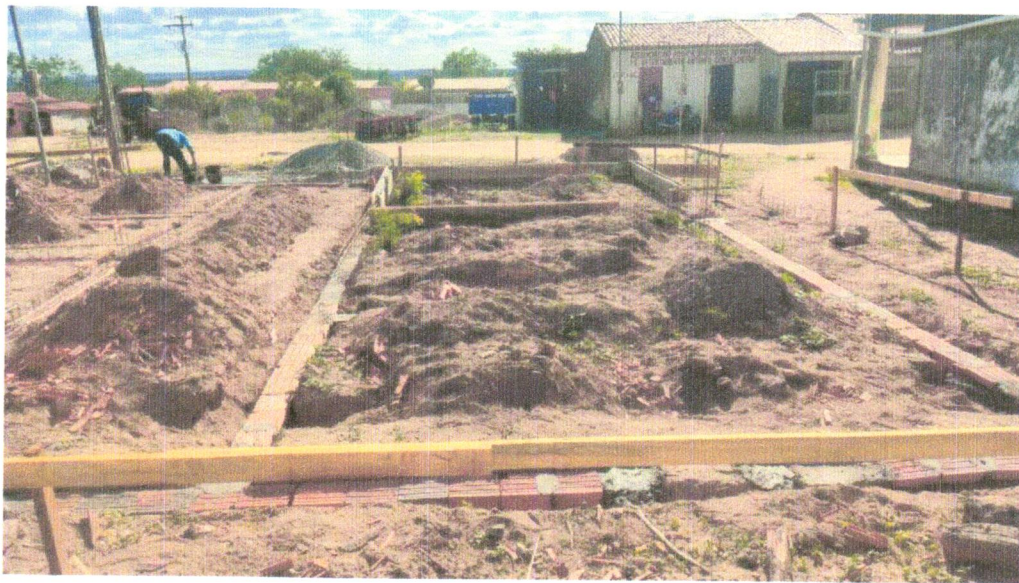
Foto 18- LOCACAO CONVENCIONAL DE OBRA, UTILIZANDO GABARITO DE TÁBUAS CORRIDAS PONTALETADAS