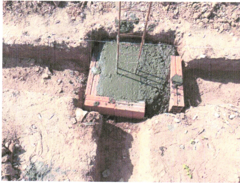
FOTO 15 - COMPOSIÇÃO REPRESENTATIVA) EXECUÇÃO DE ESTRUTURAS DE CONCRETO ARMADO, PARA EDIFICAÇÃO HABITACIONAL UNIFAMILIAR TÉRREA (CASA EM EMPREENDIMENTOS), FCK = 25 MPA. AF_01/2017