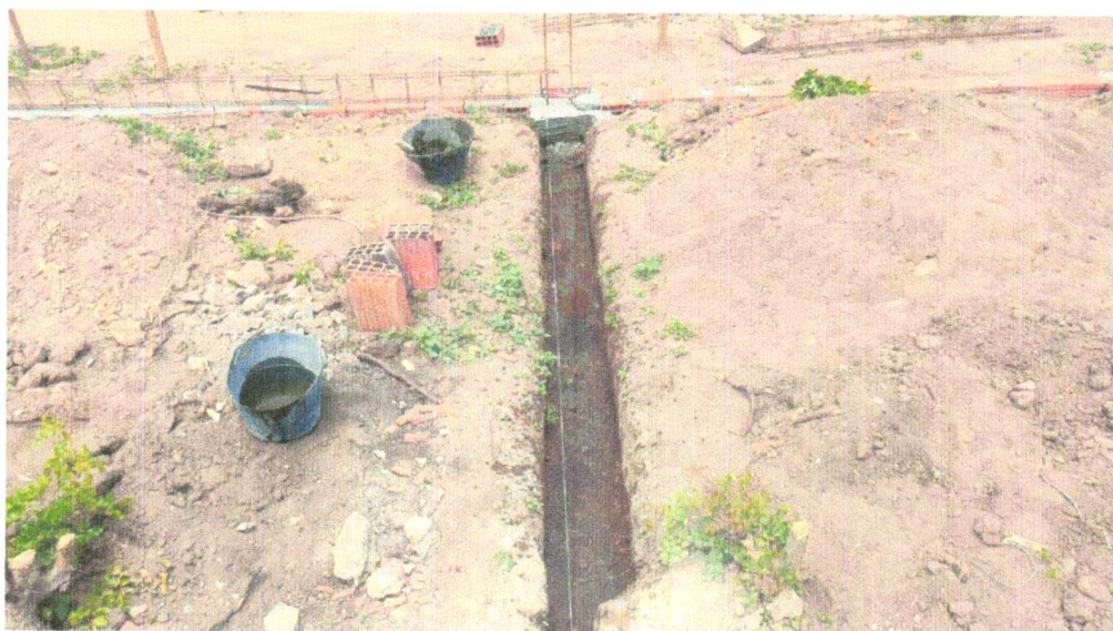
FOTO 10 - LASTRO DE CONCRETO MAGRO, APLICADO EM BLOCOS DE COROAMENTO OU SAPATAS, ESPESSURA DE 3 CM