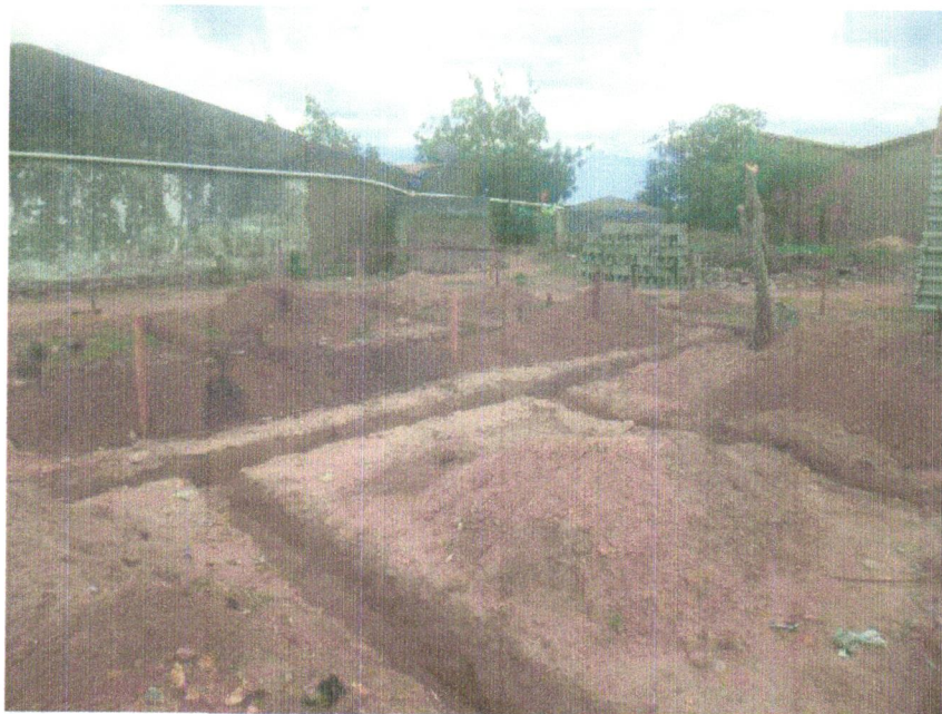
FOTO 05 – ESCAVAÇÃO MANUAL DE VALA PARA VIGA BALDRAME (INCLUINDO ESCAVAÇÃO PARA COLOCAÇÃO DE FÔRMAS). AF_06/2017

Antonio Soares Cordeiro Neto Engenheiro Civil CREA-PA 051888554-2