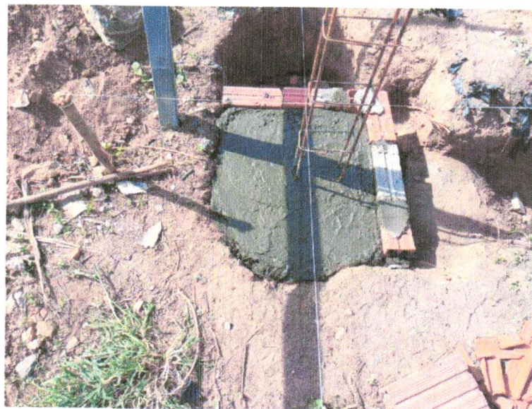
Foto 16 - COMPOSIÇÃO REPRESENTATIVA) EXECUÇÃO DE ESTRUTURAS DE CONCRETO ARMADO, PARA EDIFICAÇÃO HABITACIONAL UNIFAMILIAR TÉRREA (CASA EM EMPREENDIMENTOS), FCK = 25 MPA. AF_01/2017