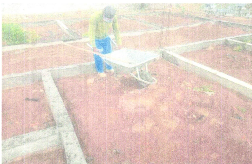
Foto 23 - ATERRO MANUAL DE VALAS COM AREIA PARA ATERRO E COMPACTAÇÃO MECANIZADA. AF