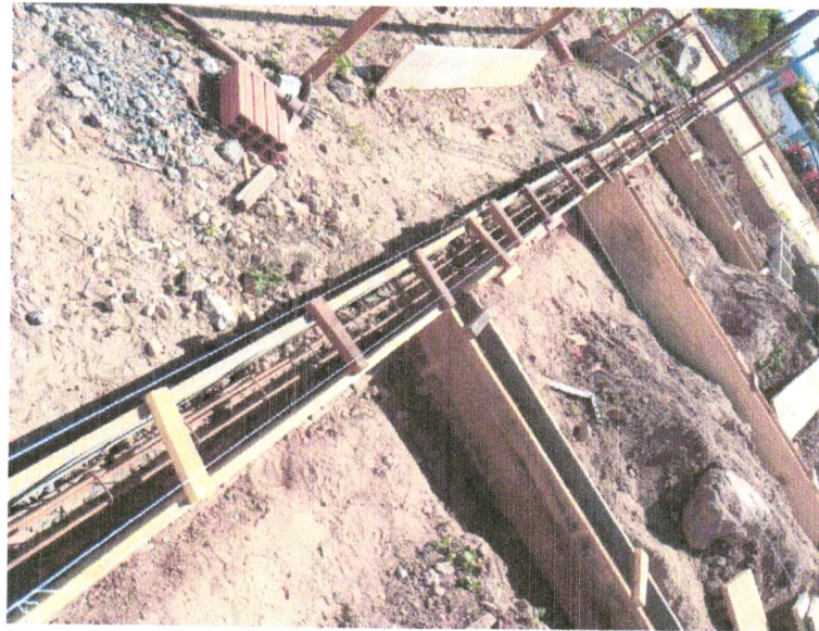
Foto 21 - COMPOSIÇÃO REPRESENTATIVA) EXECUÇÃO DE ESTRUTURAS DE CONCRETO ARMADO, PARA EDIFICAÇÃO HABITACIONAL UNIFAMILIAR TÉRREA (CASA EM EMPREENDIMENTOS), FCK = 25 MPA. AF_01/2017