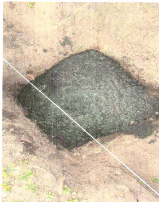
FOTO 12- LASTRO DE CONCRETO MAGRO, APLICADO EM BLOCOS DE COROAMENTO OU SAPATAS, ESPESSURA DE 3 CM