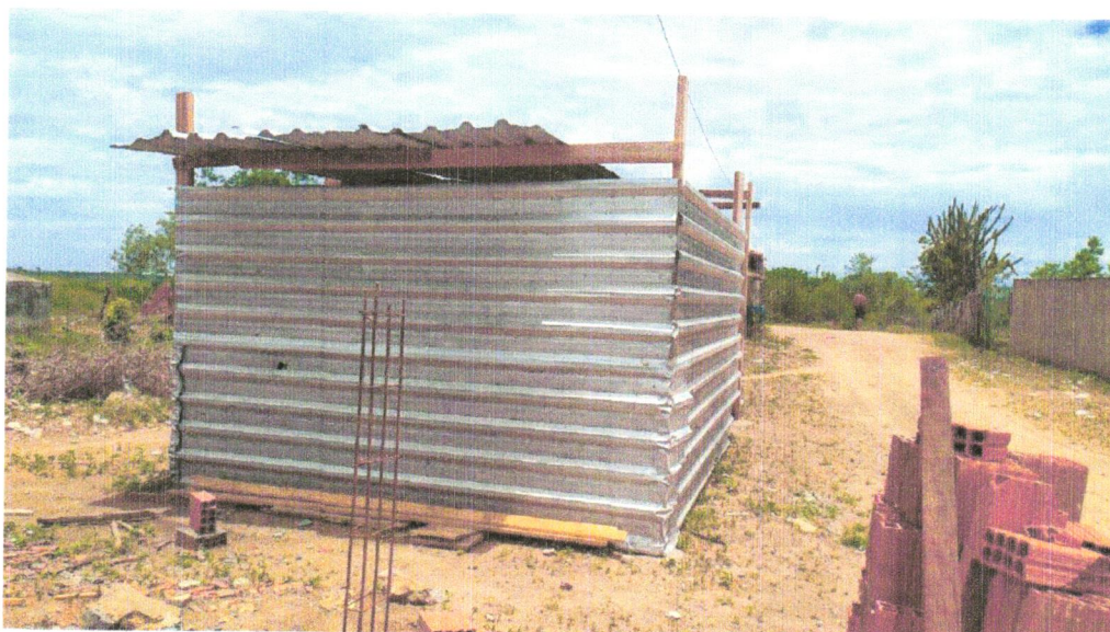
FOTO 02 – Barracão para Obras de Médio Porte Reaproveitamento 2 vezes