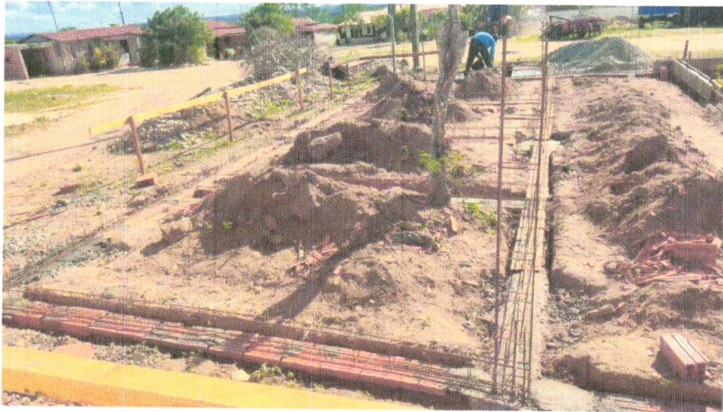
Foto 19 - LASTRO DE CONCRETO MAGRO, APLICADO EM BLOCOS DE COROAMENTO OU SAPATAS, ESPESSURA DE 3 CM